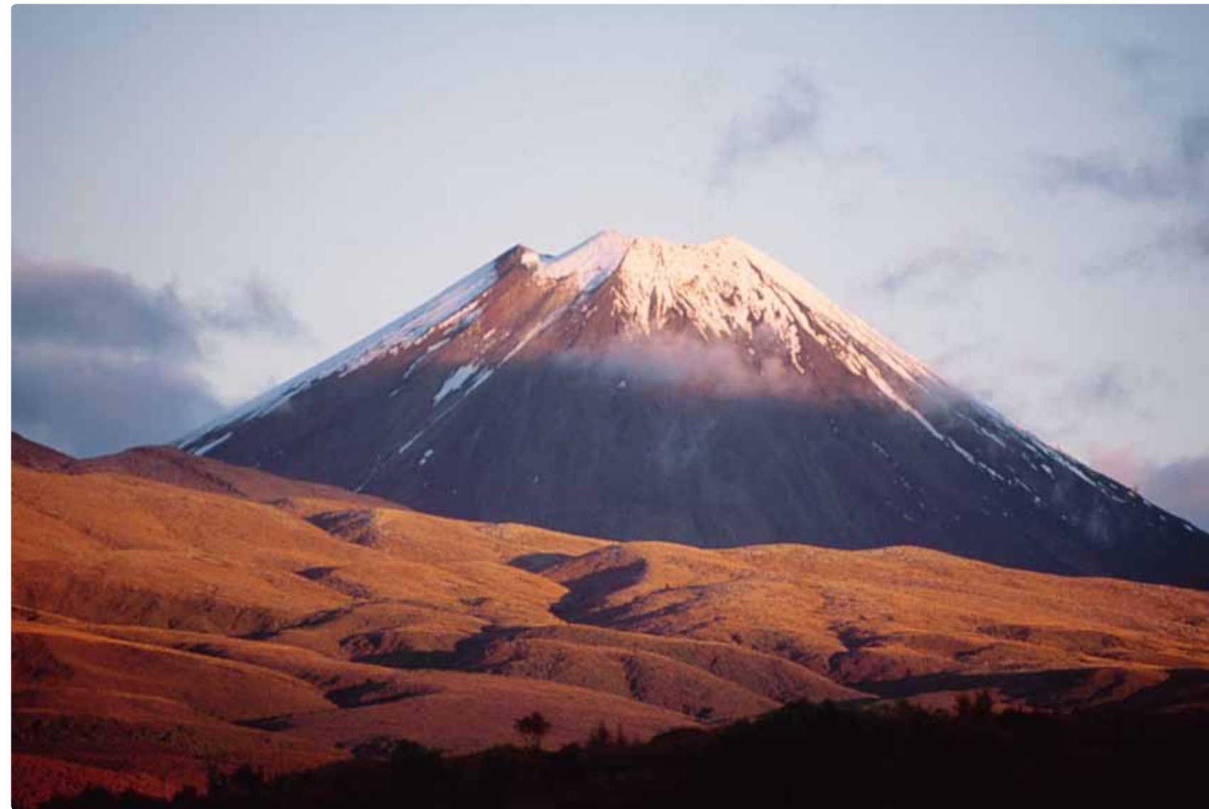
Volcan Ngauruhoe, 2 287 mètres, Tongariro National Park.