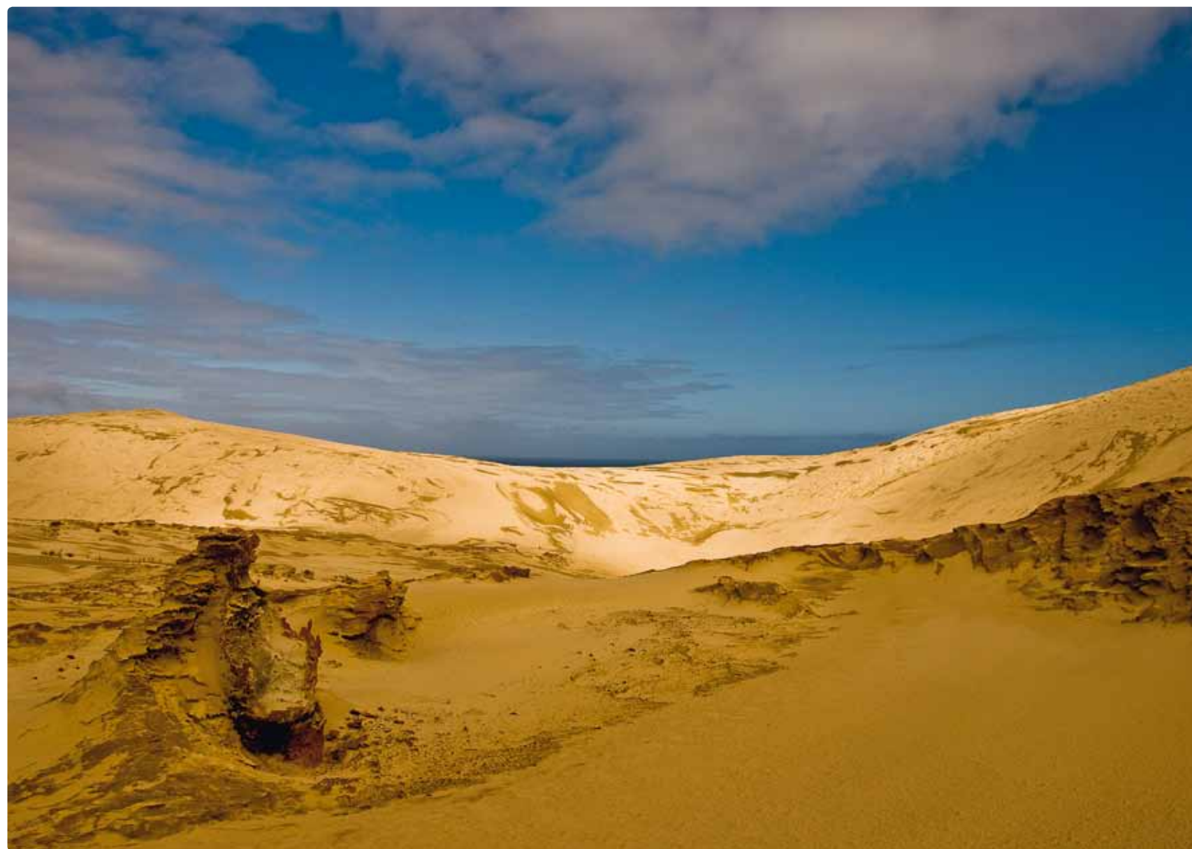
Dunes de Te Pahi (cap Reinga)