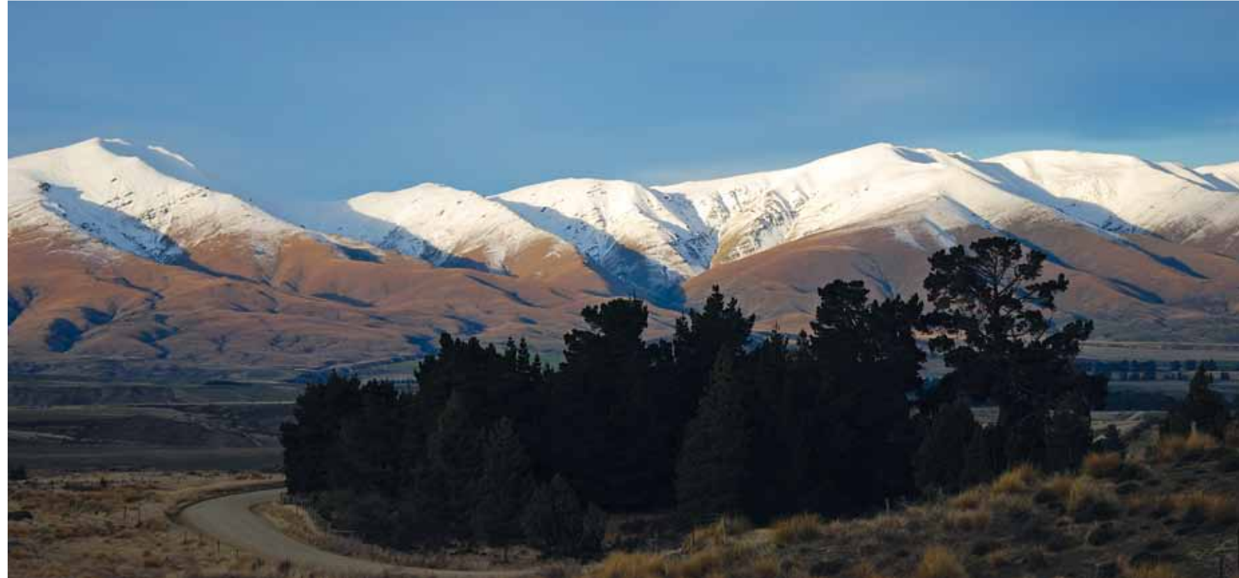
Paysage de l'Otago vers Alexandra