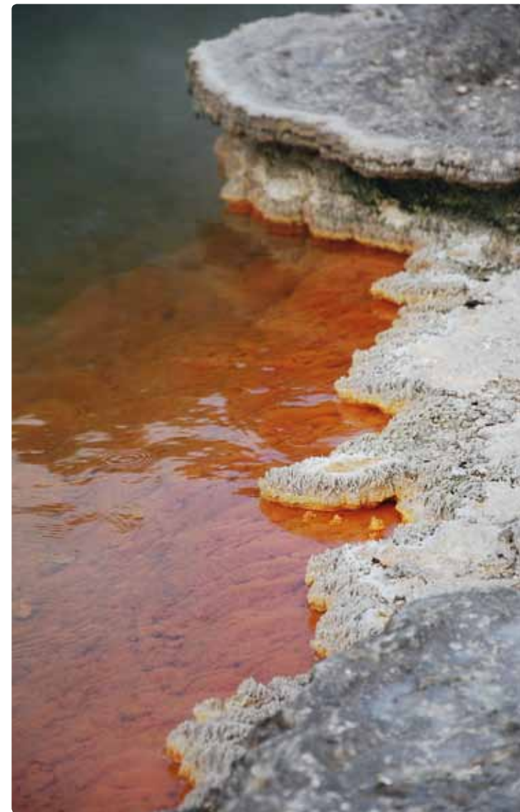
Ci-dessus : Lac de champagne à Wai-o-Tapu Ci-contre : Geyser à Wai-o-Tapu