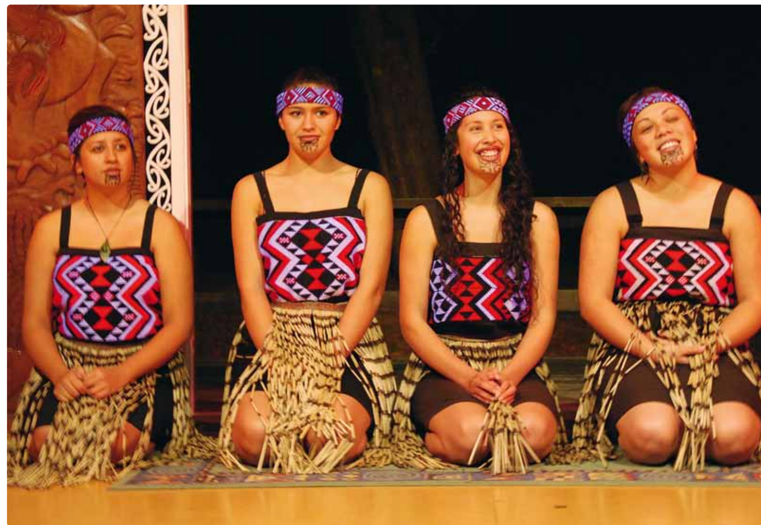
Danseuses maories à Wairakei