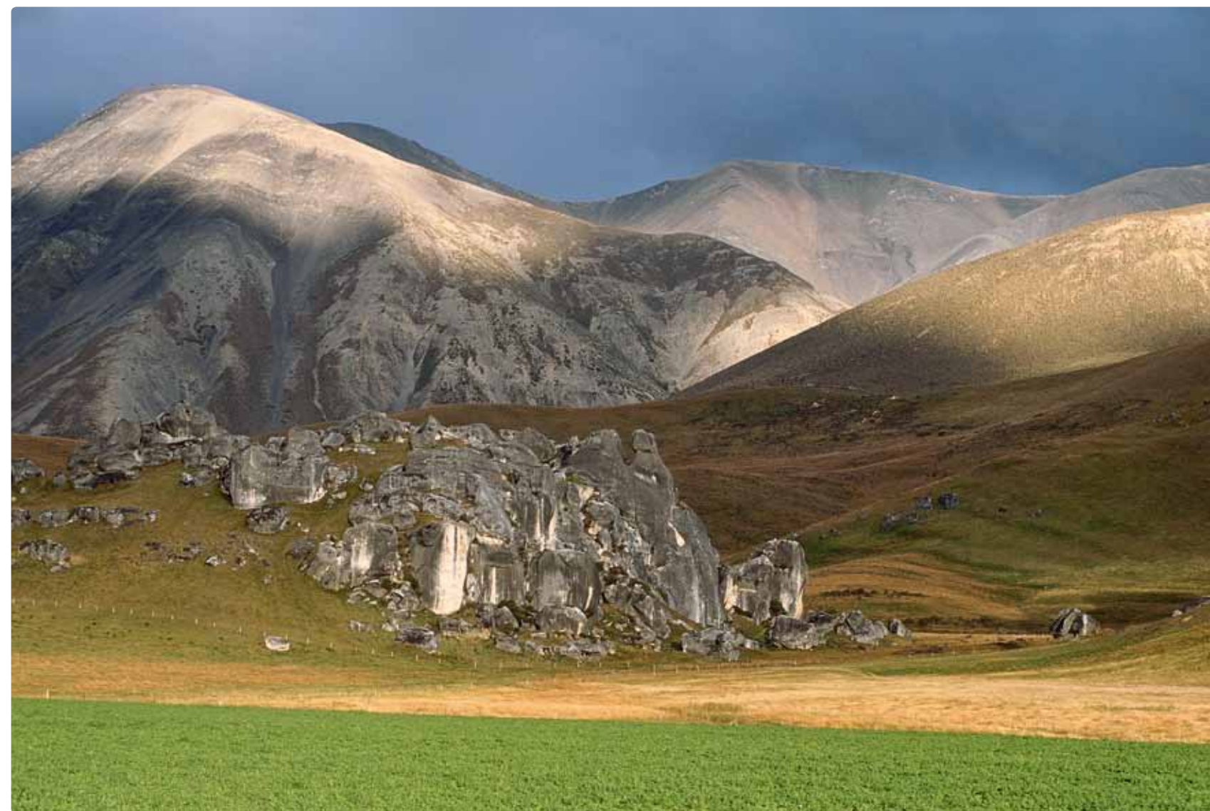
Ci-dessus : Paysage de l'Otago vers Arthurs Pass A gauche : Mine d'or à ciel ouvert à Saint Bathans